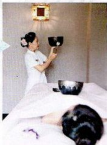
Life of Elements THB2,500/HK$610

技師由細至大的慢慢打響四個不同大小的西藏鐘鈴，鐘鈴愈大，聲音清脆；最後技師會將鐘鈴放在那的兩側及肚上，讓鈴的震動促進血液循環。