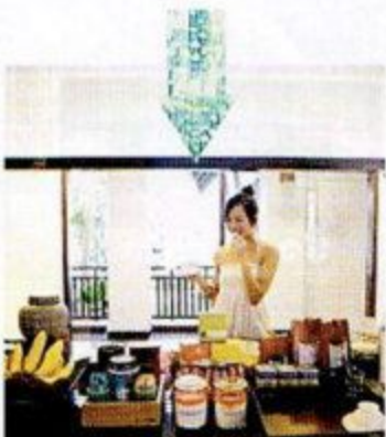
這後還有多款小食任選，休息夠了才繼續逛街！