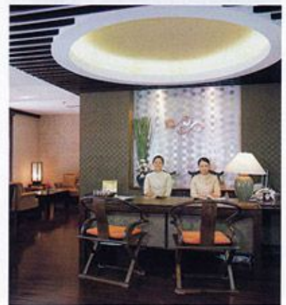
ส่วนต้อนรับแลดูสะดุดตาด้วยฝ้าเพดานวงกลมขนาดใหญ่และติดดวงไฟส่องสว่างสะท้อนกับผนังสีเงินด้านหลังเคาน์เตอร์เน้นให้โลโก้ระยิบจินดาดูโดดเด่นยิ่งขึ้น

บริเวณชั้นล่างซึ่งจัดเป็นส่วนต้อนรับและล็อบบี้มีบรรยากาศโปร่งสบายตาด้วยการตกแต่งแบบไทยร่วมสมัย เน้นการประดับโครงห้องสีขาวเกลี้ยงด้วยไม้สีเข้ม เพื่อสร้างสวยงามโดดเด่น แต่ให้ความรู้สึกเรียบง่ายสไตล์เอเชียอยู่ในที่ นอกจากนี้ยังเสริมด้วยโทนสีเด่นตามจุดใช้งานต่างๆ อย่างพอเหมาะ อาทิ การตกแต่งส่วนเคาน์เตอร์ต้อนรับด้วยผนังสีเงินระยิบระยับเพื่อให้แลดูสะดุดตาสำหรับผู้มาเยือน หรือการตกแต่งผนังในบริเวณที่นั่งพักผ่อนด้วยภาพดอกไม้สีสันสดใส เพื่อสร้างความรู้สึกละมุนและปรับสภาพจิตใจของผู้มาใช้บริการก่อนการเข้ารับการทำสปา เป็นต้น