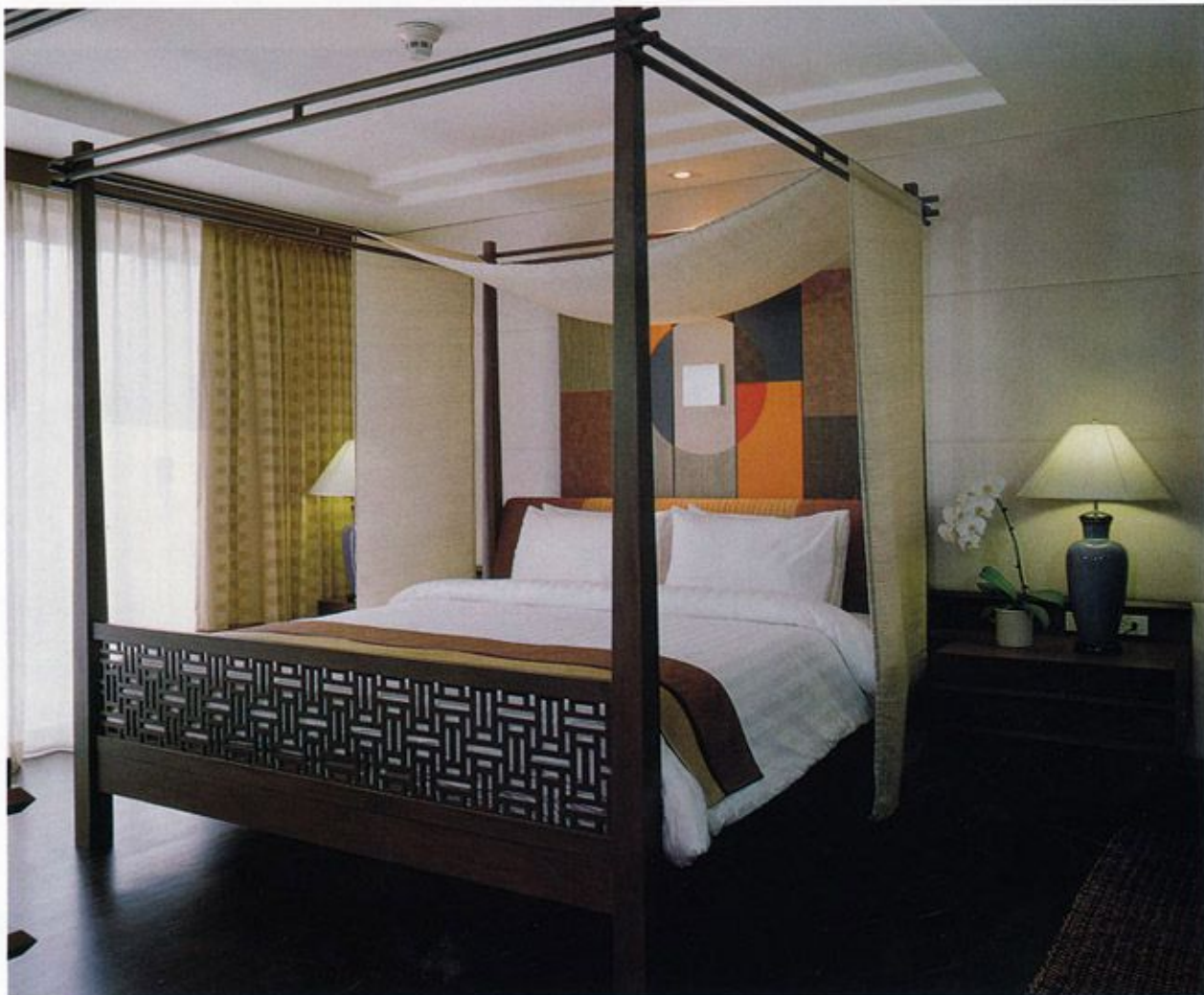
ห้องนอนตกแต่งเรียบโปร่งด้วยโทนสีอ่อน ปูพื้นด้วยไม้ รับกับเฟอร์นิเจอร์และของประดับ แบบร่วมสมัยจัดเข้ามุม เสริมจุดเด่นด้วยผนังหัวเตียงที่เป็นลักษณะ Contemporary Art

The essence boutique resort situated in the heart of Chiang Mai City offers four categories of 35 luxurious deluxe and suite rooms; 22 Deluxe Rooms (46 sqm), 7 Deluxe Pool Access Rooms (53 sqm), 5 Wellness Suites (93 sqm) and 1 RarinJinda Villa (164 sqm), embellished and decorated with modern setting. All rooms are decked with private veranda, ceiling fans; overlooking swimming pool with selected rooms can view Doi Suthep Mountain and Ping River. One of the best venues to witness the most stunning view of Lanna rich cultural Festivities and celebrations.