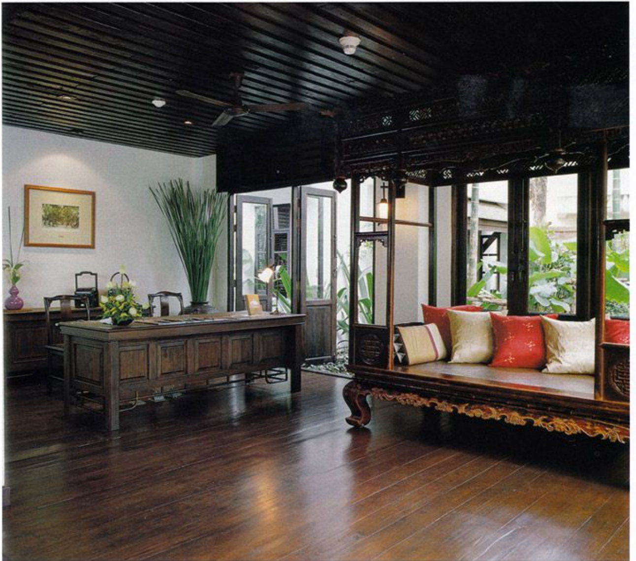
อีกด้านหนึ่งของส่วนต้อนรับ จัดบรรยากาศแบบ Open Air กรุแต่งด้วยไม้ เสริมจุดเด่นด้วยที่นั่งพักคอย ซึ่งเป็นตั้งไม้โบราณจากจีน

แนวคิดในด้านสถาปัตยกรรมมุ่งเน้นให้เอื้อต่อการใช้สอยและเข้ากันได้กับสภาพแวดล้อม ที่สำคัญคือมีภาพรวมรับกับเรือนโบราณที่มีอยู่เดิมซึ่งเป็นเรือนไม้สักสีน้ำตาลเข้ม เพดานสูง หลังคาเป็นทรงปั้นหยาซ้อนชั้นที่มีชายคายื่นคลุมโดยรอบ ซึ่งผู้ออกแบบได้นำเค้าโครงโดยรวมตลอดจนรูปทรงและโทนสีของเรือนเก่ามาปรับประยุกต์เป็นแนวคิดหลักในการออกแบบอาคารหลังอื่นๆ โดยผสมผสานเข้ากับดีไซน์แบบสมัยใหม่ที่เรียบง่าย โปร่งโล่ง ตอบรับการใช้งานได้อย่างเต็มที่ ออกมาในลักษณะอาคารคอนกรีตสีขาวทรงสูง วางผังล้อกับที่ดิน มีหน้าตากระ-