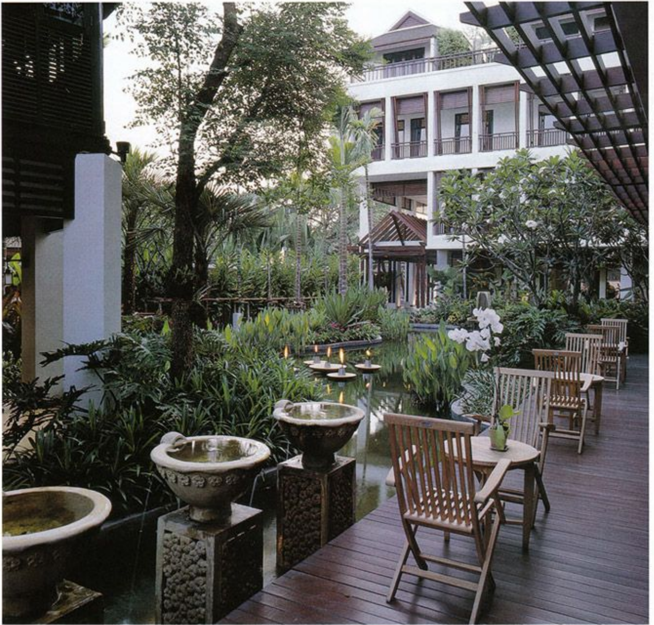
มุมพักผ่อนจัดอยู่บนเฉลียงไม้ด้านข้างอาคาร ขนาดด้วยสวนและสระน้ำรูปทรงฟรีฟอร์มเป็นธรรมชาติ

RarinJinda Wellness Spa Resort specializing in pure pampering gets away from the chaos of daily life. A truly remarkable sanctuary catering to your every indulgence where you can find sumptuous experience in today's most up-to-date treatments in health and fitness include fully equipped Indoor Heated Hydrotherapy Pool, Outdoor Swimming Pool, Fitness Centre, Yoga & Aerobics Studio, Hydrotherapy