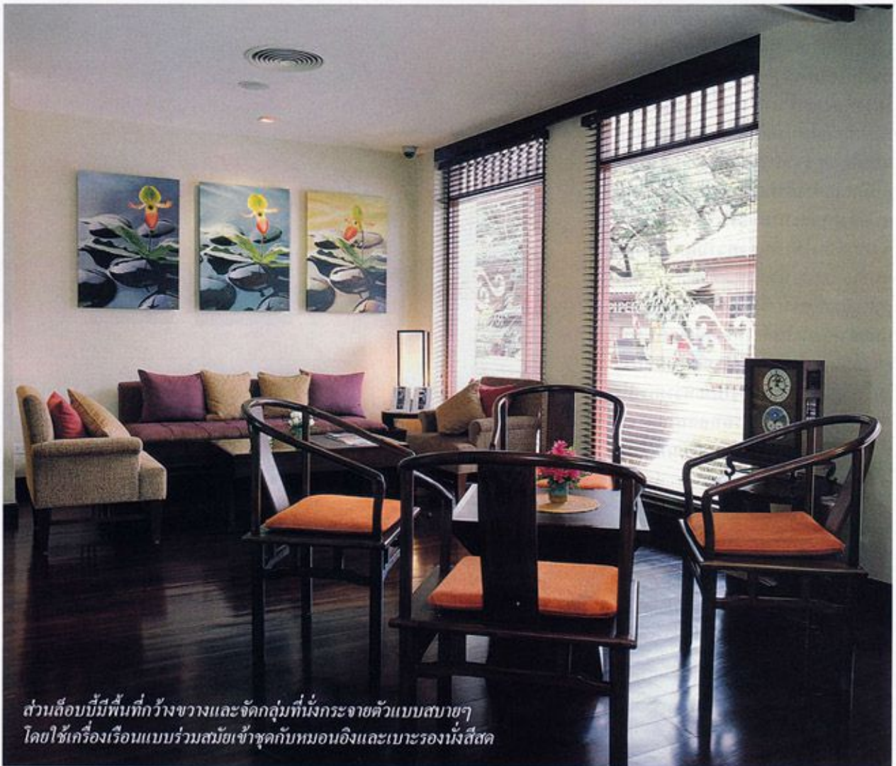
ส่วนล็อบบี้มีพื้นที่กว้างขวางและจัดกลุ่มที่นั่งกระจายตัวแบบสบายๆ โดยใช้เครื่องเรือนแบบร่วมสมัยเข้ากับหมอนอิงและเบาะรองนั่งสีสด

หัวใจสำคัญอีกอย่างหนึ่งที่เป็นของ RarinJinda Wellness Spa Resort ก็คือสถานบริการสปาที่ตั้งอยู่ด้านหน้าของตัวโรงแรมแห่งนี้ โดยอาคารสปานั้นอยู่ติดกับถนนเจริญราษฎร์หันหน้าไปทางแม่น้ำปิงตัวอาคารทรงเหลี่ยมสีขาวได้รับการตกแต่งด้วยไม้สีเข้มแบบร่วมสมัย เพื่อให้มีภาพลักษณ์ที่แตกต่างกับบ้านไม้สักโบราณซึ่งเป็นส่วนของล็อบบี้โรงแรมด้านใน นอกจากนี้ยังจัดให้มีสวนและสระน้ำเพื่อช่วยเพิ่มความสดชื่นและเป็นเสมือนหนึ่งการเชื่อมต่อระหว่างความหนาวสะอาดอันของอาคารสปาแบบสมัยใหม่และความขรุขระของบ้านไม้ให้กลมกลืนกันยิ่งขึ้น