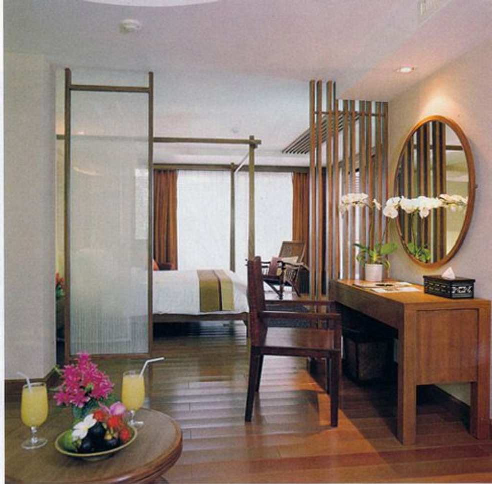
Wellness Suite ตกแต่งสไตล์โมเดิร์น- โอเรียนทัล ในโทนสีอิฐโทน ไม้ ทาสีและผ้าทอพื้นเมืองเป็นวัสดุหลัก โดยจัดเป็นส่วนพักผ่อน ส่วนอ่านหนังสือ และส่วนนอน อยู่ใน Space ที่ต่อเนื่องกัน