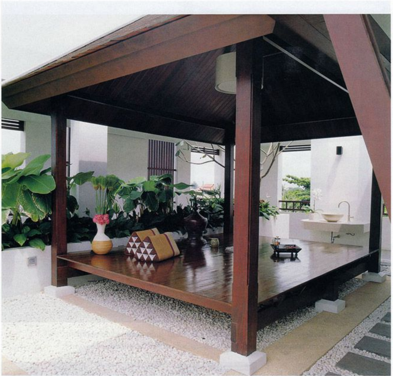
ศาลาพักผ่อนจัดอยู่รอบระเบียง บังสายตาด้วยกำแพงโอปอลล้อมและปลูกต้นไม้โดยรอบ เสริมการใช้งานด้วยทางเดินหิน

ส่วนห้องพักมีบริการทั้งหมด 35 ห้อง จัดแยกเป็นสัดส่วนอยู่ในอาคารด้านหลัง โดยมีทั้งห้องsuiteใหญ่ อย่าง RarinJinda Villa ซึ่งจัดอยู่ชั้นบนสุดของอาคารเปิดมุมมองเห็นทิวทัศน์ได้กว้างไกล ภายในประกอบด้วยส่วนพักผ่อน ส่วนรับประทานอาหาร ศาลาพักผ่อน ห้องนอน Walk-in Closet ห้องน้ำ จากชัชและระเบียงขนาดใหญ่ นอกจากนี้ยังมีห้องsuiteขนาดกลาง อย่าง Wellness Suite ซึ่งมีบรรยากาศอบอุ่นสบายๆ ภายในมี