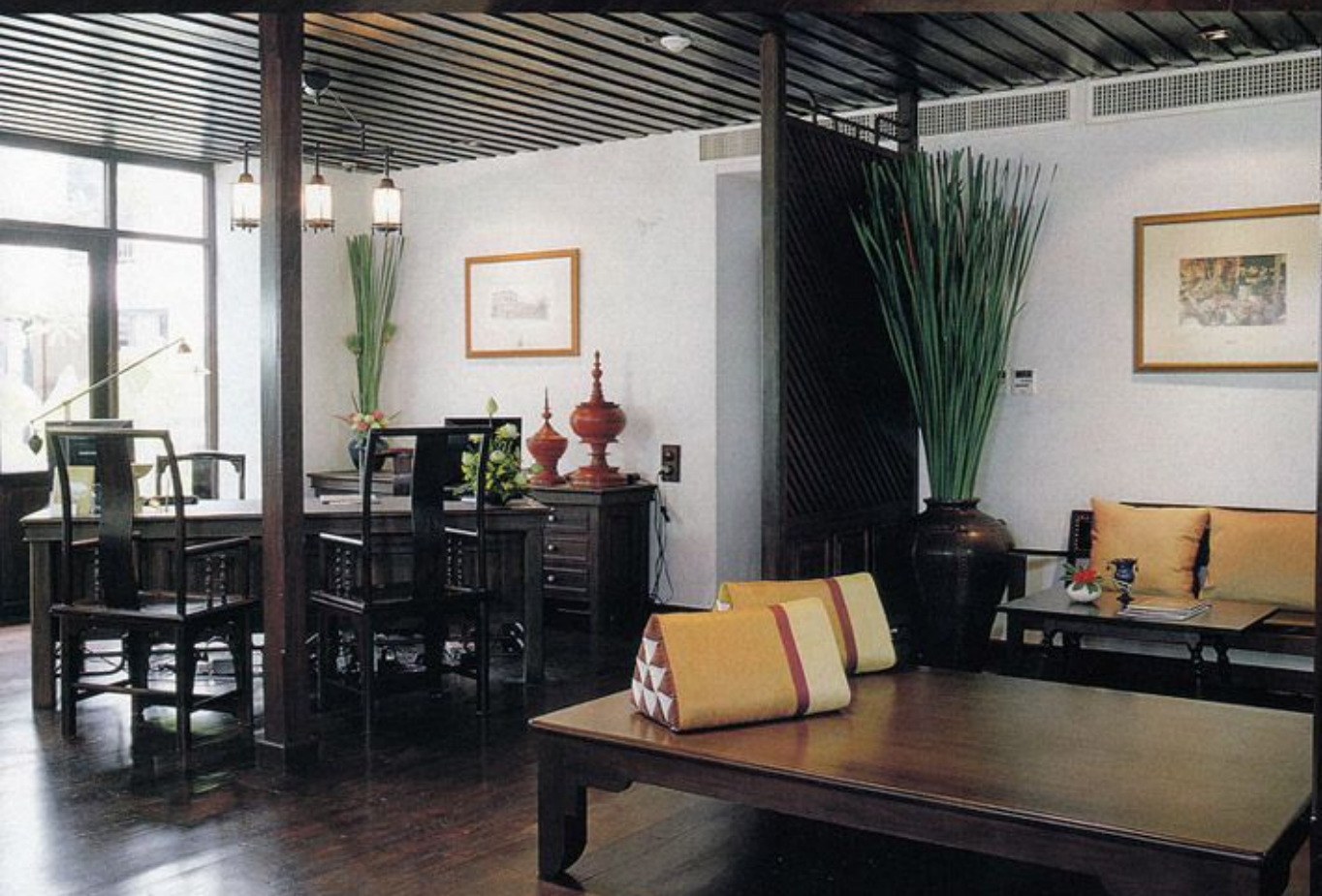
ส่วนต้อนรับจัดอยู่ภายในเรือนไม้โบราณที่ปลูกสร้างอยู่เดิม โดยตกแต่งแบบโคโลเนียลผสมผสานเฟอร์นิเจอร์และของประดับทั้งแบบไทย จีน และตะวันตกอย่างกลมกลืน