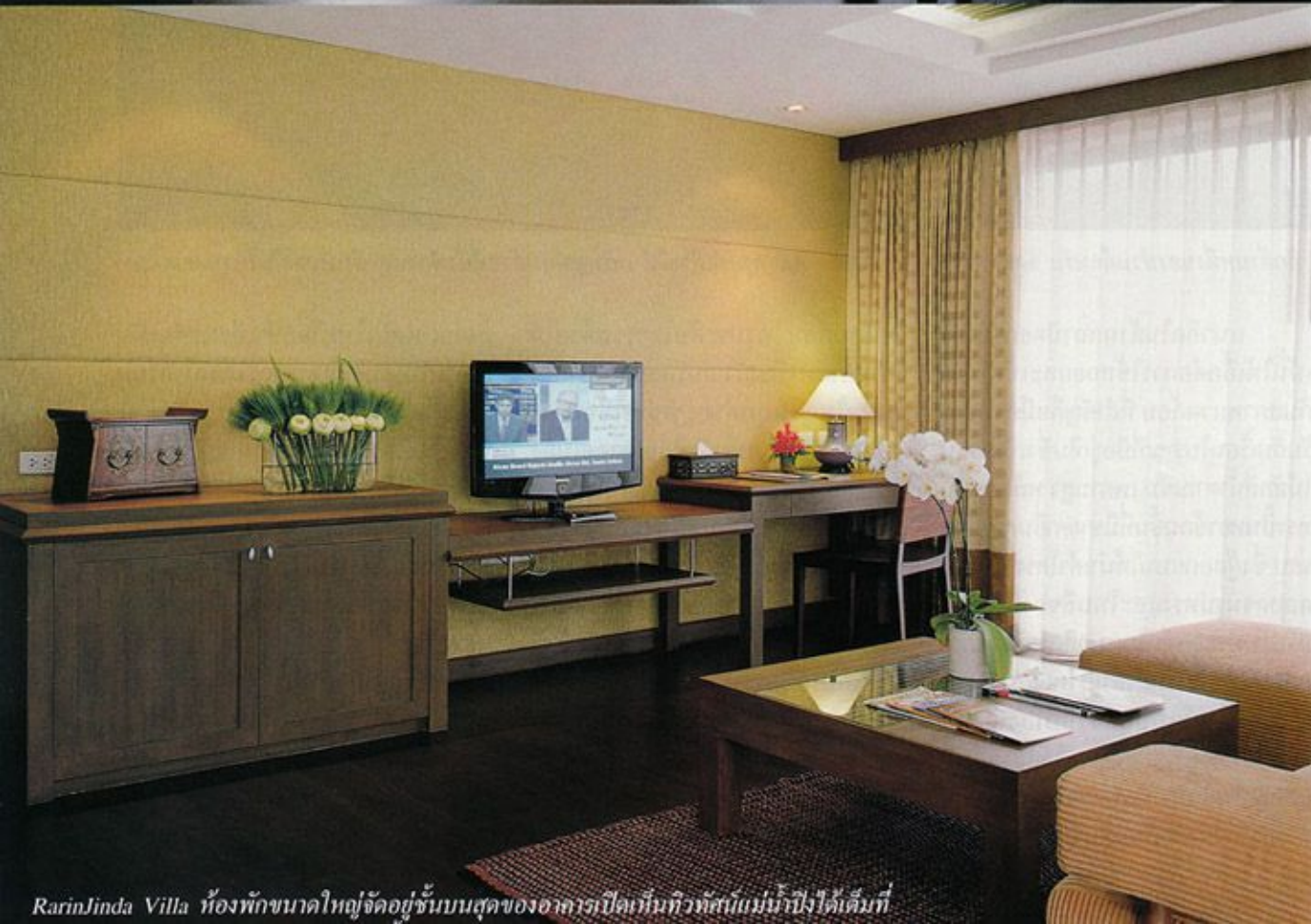
RarinJinda Villa ห้องพักขนาดใหญ่จัดอยู่ชั้นบนสุดของอาคารเปิดเห็นทิวทัศน์แม่น้ำโขงได้เต็มที่